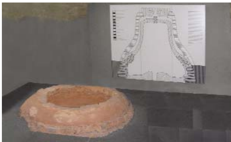
Glockengussplatz, Präsentation im Stadtmuseum 2006

Glockengießer waren in der Stadt und Abt Bertram vom Bellinghausen nutzte die Gelegenheit, zwei neue Glocken für die Abteikirche in Auftrag zu geben, „eine im Gewichte vom 4.978 Pfund, die ande- re im Gewichte von 2.910 Pfund“, wie die