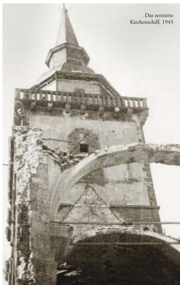
Das zerstörte Kirchenschiff, 1945

gewidmet, die zweite dem hl. Mauritius und seinen Gefährten. Der auf Abt Bertram von Bellinghausen folgende Abt, Abt Johann von Bock, begann im Jahre 1649 mit dem Neubau der Abteikirche in barocker Gestalt, ein Vorhaben, das 1667 abgeschlossen werden konnte.