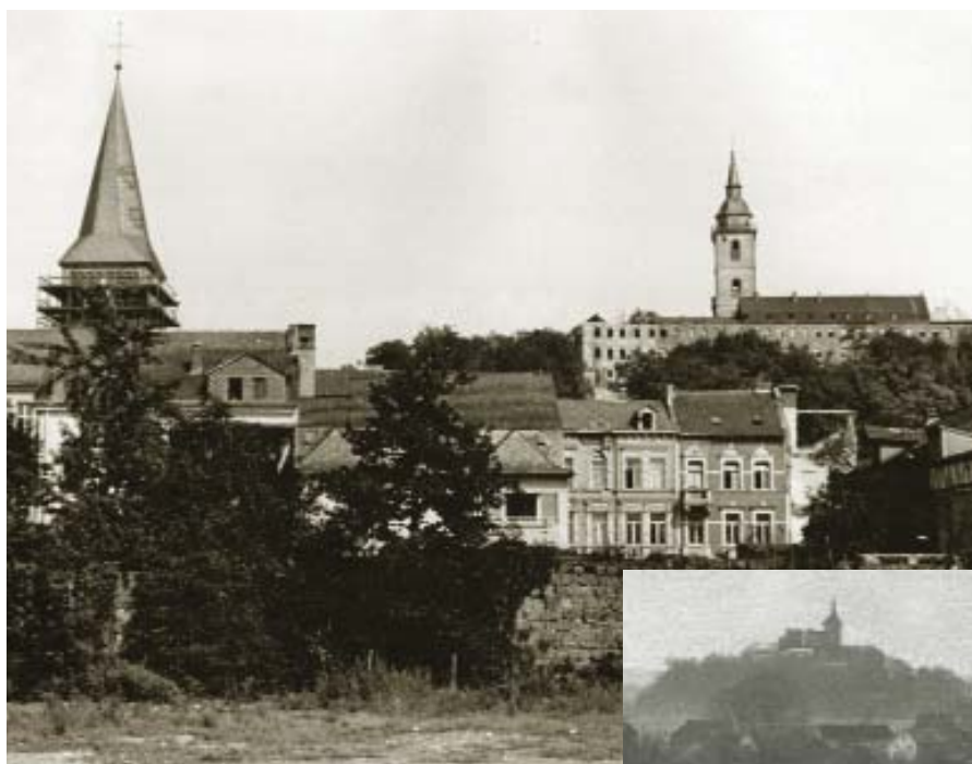
Blick auf die Kriegszerstörte Abtei, um 1947

Dabei war der Berg fast 160 Jahre stumm gewesen. Mit der Auflösung der Abtei im Jahre 1803 in Folge der Napoleonischen Kriege, wurden die Mitglieder des Konvents vertrieben und das gesamte Inventar verkauft und in alle Winde verstreut. Damals verschwanden auch die Glocken aus dem Kirchturm der Abtei, und der Berg versank in Schweigen.