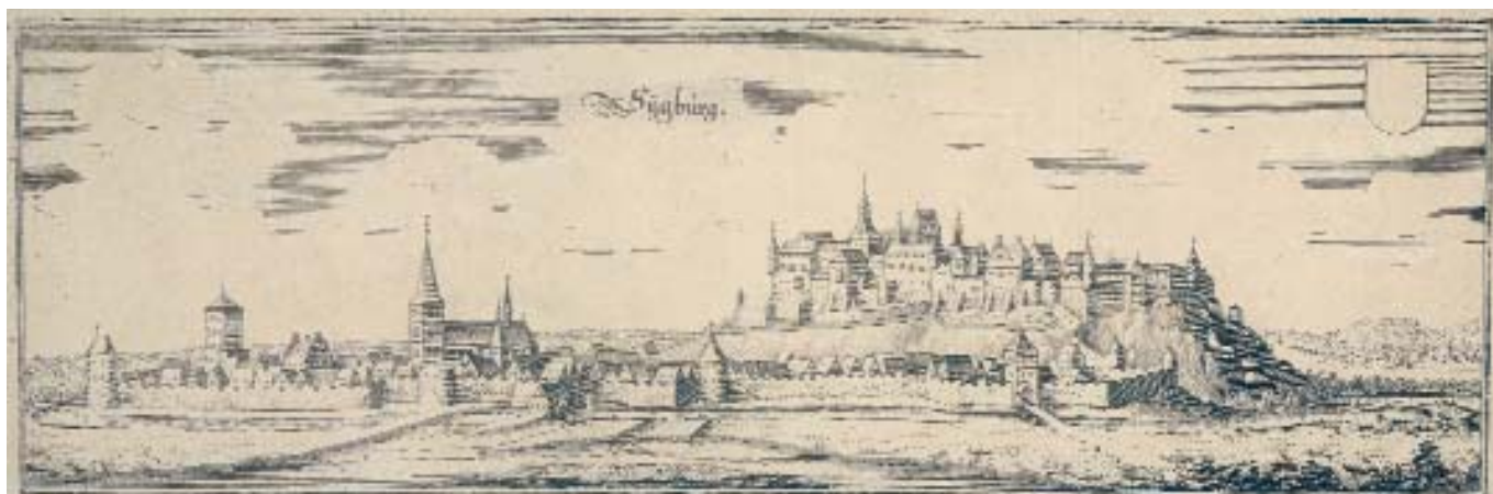
Merianstich, Siegburg mit Abtei, um 1645

Aus der Technikgeschichte des Glockengusses wissen wir, dass im 12. Jahrhundert Gussverfahren und Glockenformen nicht der seit der Neuzeit üblichen Herstellungstechnik und Formgebung entsprechen. Die Glocken hatten eine gedrungenmassige Form und klangen dumpfdunkel. Glockenfachleute mutmaßen, dass unseren heutigen Hörgewohnheiten diese Glockentöne wohl gar nicht zusagen und statt an Lobpreisung eher an dumpfes