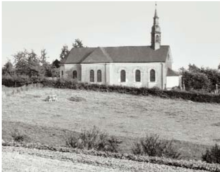
Die „Braschosser Kapelle“ um 1950

Die unterhalb des Klosters, in Richtung auf den Ort hin auf der anderen Straßenseite liegende St. Rochus-Kapelle wurde 1709 zum Dank für die Abwendung der Roten Ruhr erbaut, einer ansteckenden Darmkrankheit, die in Siegburg zahlreiche Opfer gefordert hatte. Im Mittelalter riefen die Gläubigen den Hl. Rochus als Patron gegen die Pest an, da seine Heiligenlegende unmittelbar mit dieser Krankheit verknüpft ist.