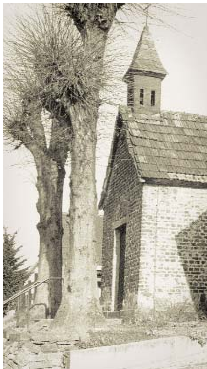
Ansicht der Kaldauer „Alten Kapelle“ um 1970

jeden Donnerstag die Messe gelesen, um für die an der Front stehenden oder in Gefangenschaft festgehaltenen Soldaten, besonders für die aus Kaldauen stammenden, zu beten.