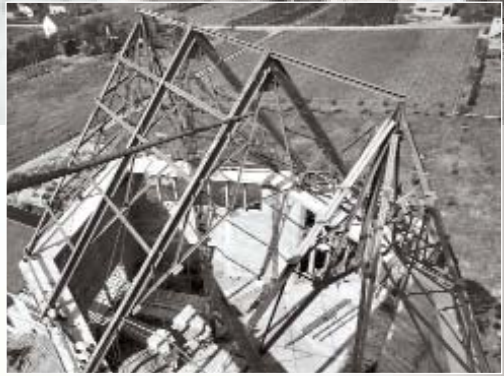
Blick in das Kirchenschiff beim Neubau

Nach dem Zweiten Weltkrieg, verstärkt durch die Eingemeindung am 1. Oktober 1956 nach Siegburg, begann Kaldauen sich zu einer der bevorzugten Wohngegenden der Kreisstadt zu entwickeln. Allein im Zeitraum von 1945 bis 1963 stieg die Einwohnerzahl von 700 auf ca. 2.500, heute leben hier mehr als 10.000 Menschen. Da konnte es nicht ausbleiben, daß die Forderung aufkam, alle zu einer Pfarre notwendigen Einrichtungen in Kaldauen zu konzentrieren.