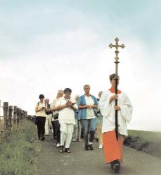
Rochusprozession der Braschosser Kirchengemeinde 2001

Die steinerne Kreuzigungsgruppe, linker Hand auf dem Weg zur Kirche vor der Westfassade, knüpft an diese Friedhofstradition an. Sie ist in der für das Rheinland typischen Form des erweiterten Hochkreuzes ausgebildet: Sie zeigt neben der Figur des gekreuzigten Jesus Christus, in lebensgroßen Steinfiguren rechts von ihm Maria und links Johannes, der in der rechten Hand ein mit kunstvoll verziertem Deckel geschmücktes Buch hält, das ihn als Evangelisten ausweist. Hochkreuze dieser Art wurden seit dem 16. Jahrhundert besonders gerne als Friedhofskreuze verwandt, und