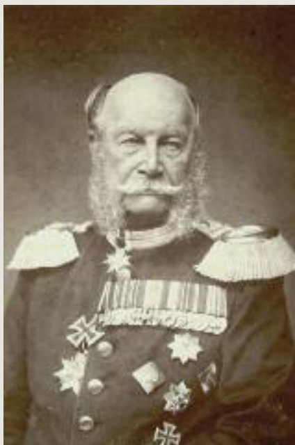
Kaiser Wilhelm I.