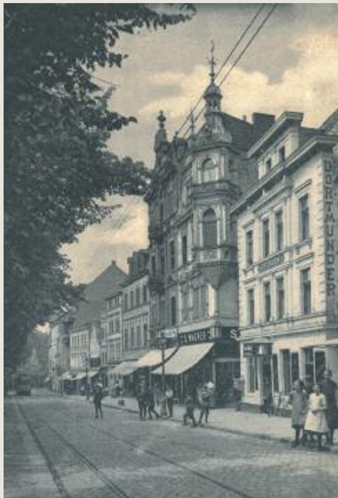
Blick marktabwärts, am Eckhaus mit Türmchen geht man heute zum Nogenter Platz.