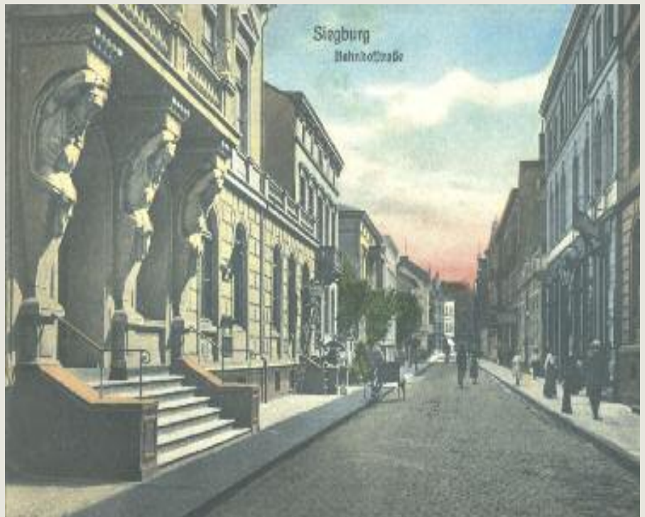
Das Portal links gehört zum damaligen Postamt, das mit dem Bau der neuen Post 1933 nicht mehr benötigt wurde.

Erst viel später wurde das Gebiet des heutigen S-Carrées in die Bebauung genommen und eines der ersten großen, neuen Gebäude war die neue Post, eingeweiht 1933. Damit erhielt die Straße auch ihren Namen „Neue Poststraße“ und führte damals wie heute stracks zum Bahnhof.