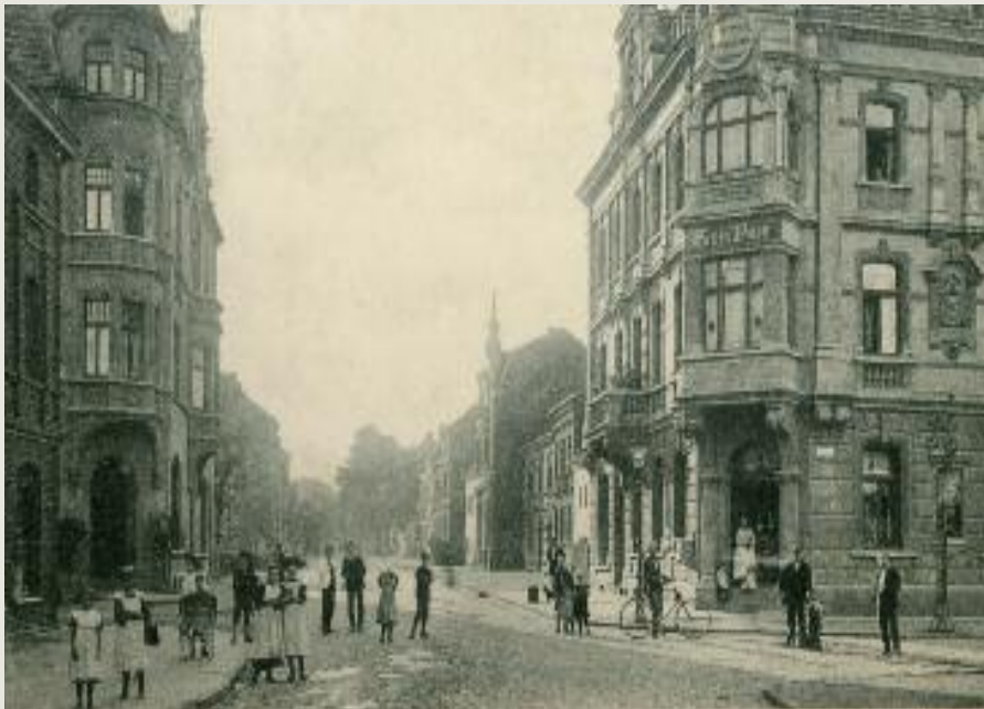
Die Luisenstraße, rechts das Lokal „Zum Faß“, um 1910