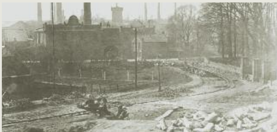
Die Heinrichstraße zum Zeitpunkt des Ausbaus, 1927. Rechts die Mauerbegrenzung des jüdischen Friedhofs.