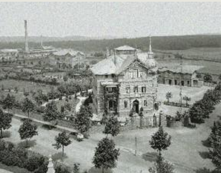
Blick auf die Direktorenvilla an der Luisenstraße und das Feuerwerkslaboratorium, um 1910.

Nun sollte in Siegburg eine neue, die zweite preußische Munitionsfabrik entstehen. Was lag da näher, als der Straße, die zu dieser Arbeitsstätte führte, den Namen dieser verehrten Königin zu verleihen – die Luisenstraße war begründet.