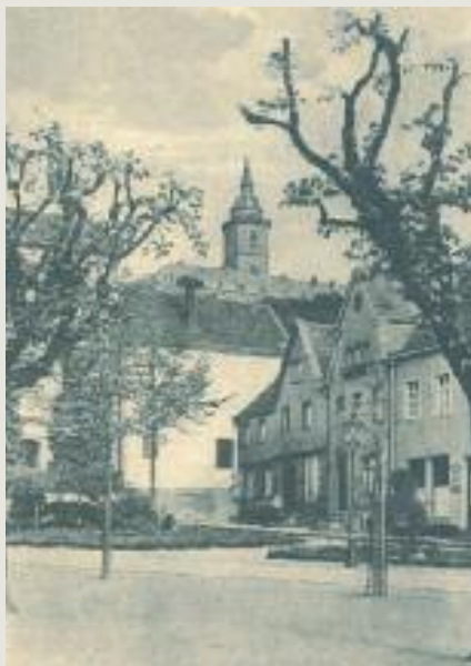
Der Hühnermarkt, um 1930

Während die Aulgasse als Töpferstadt ihren Namen von den dort lebenden und arbeitenden Handwerkern, den Ulnern, erhielt, ergaben sich Namen wie Sternengasse oder Meisengasse aus Hausnamen, während die Brandgasse vielleicht auf eine besonders im Gedächtnis der Bevölkerung verhaftet gebliebene Brandkatastrophe verweisen könnte – wir wissen es nicht.