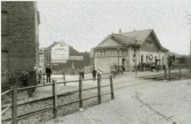
Der Nordbahnhof in der Kronprinzenstraße