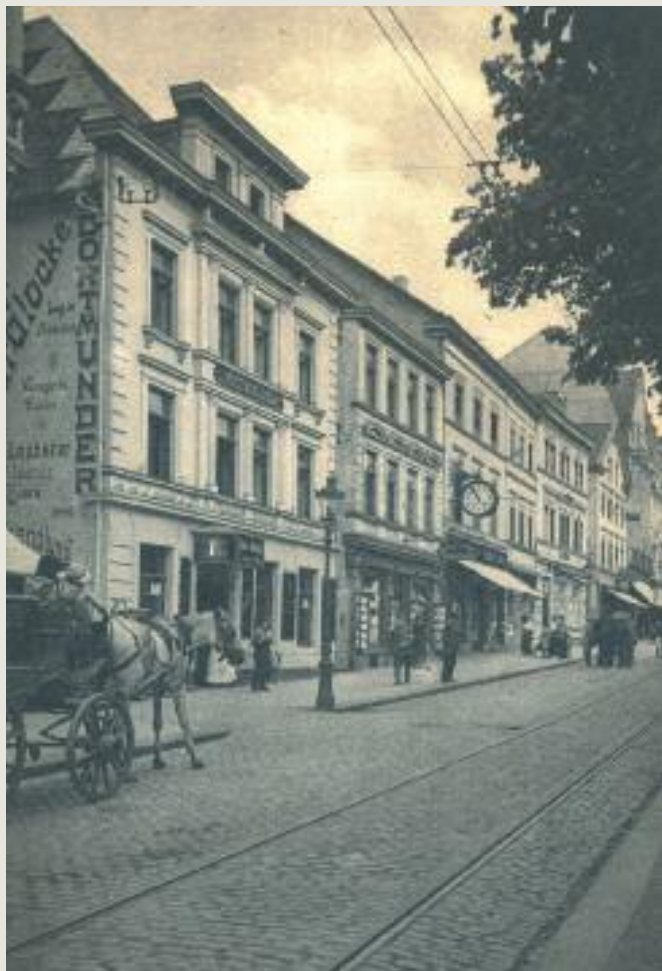
Blick marktaufwärts, um 1930