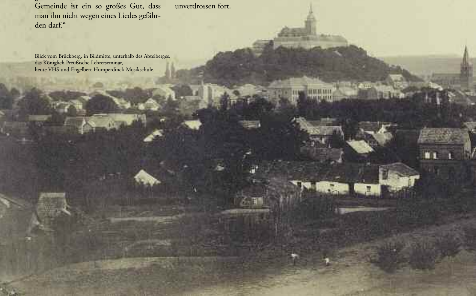
Blick vom Brückberg, in Bildmitte, unterhalb des Abteiberges, das Königlich Preußische Lehrerseminar, heute VHS und Engelbert-Humperdinck-Musikschule.