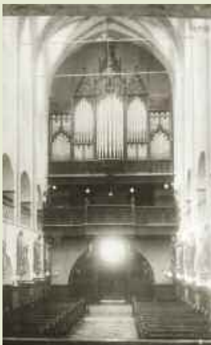
St. Servatius, alte Orgel.