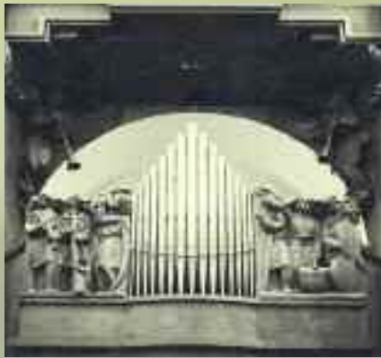
St. Servatius, Teil des Orgelprospekts der Orgel um 1930.