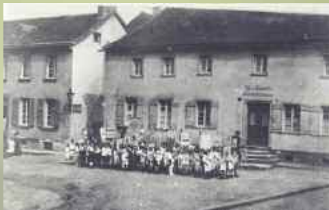
Fronleichnam-Prozession auf dem Kirchplatz. Blick von der Mühlenstraße, rechts im Bild das Haus Kirchplatz 1.

„Ein gut gepflegter kirchlicher Volksgesang trägt zweifelsohne zur Bildung des Herzens, zur Veredelung des Geistes und zur Belebung der Frömmigkeit wesentlich bei.“ Im „Gehorsam gegen die Vorschriften der heiligen Kirche“ freilich müsse man sich, so Mohr, „allerorten darum bemühen, der liturgischen Sprache die ihr gebührende Stelle wieder einzuräumen, und verweist das deutsche Kirchenlied dorthin, wohin es gehört, d.h. in den außerliturgischen Gottesdienst.“ Mohr nennt als Beispiel Prozessionen und Andachten. Bei diesen „Gelegenheiten“ könne das deutsche Kirchenlied „unschätzbare Dienste zur Belebung der Frömmigkeit leisten.“