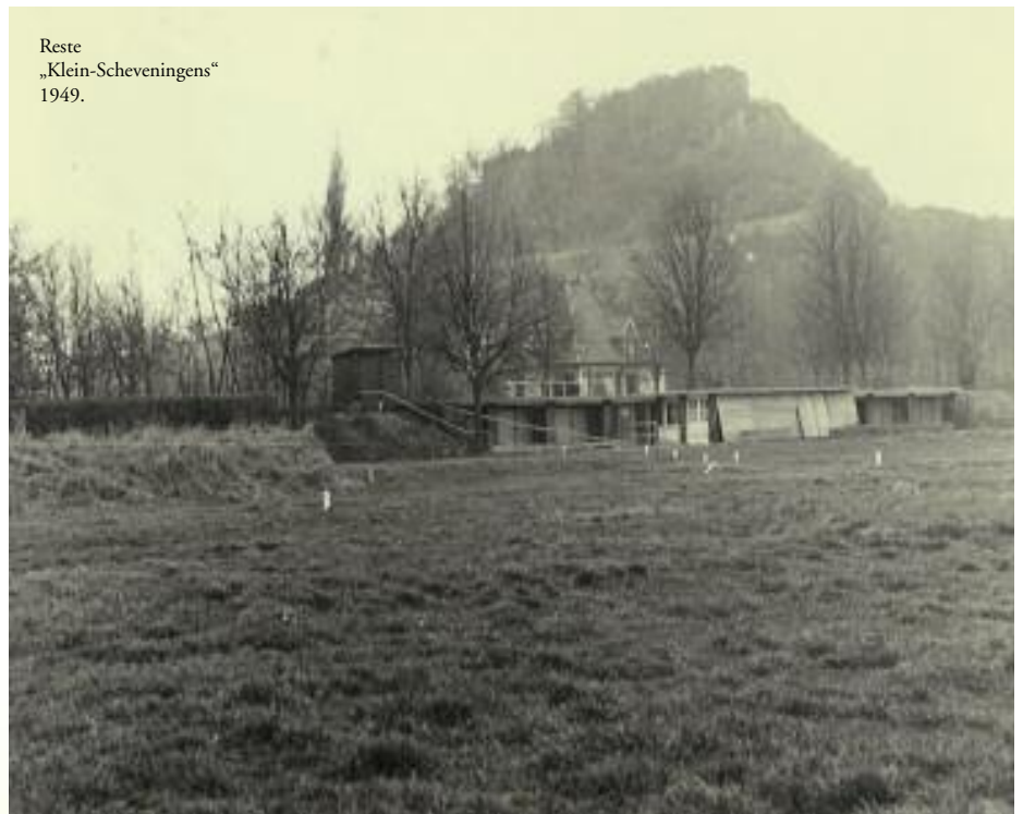
Reste „Klein-Scheveningen“ 1949.

Doch die Freude währte nicht lange: Mit Beginn der Badesaison 1955 empfing die Siegburger das wenig einladende Schild: „Städtisches Licht- und Luftbad. Das Baden in der Sieg geschieht auf eigene Gefahr!“ Im September desselben Jahres wurde über das Gesundheitsamt des Siegkreises beim Hygiene-Institut der Universität Bonn eine gutachterliche Stellungnahme in der Angelegenheit Strandbad Siegburg in Auftrag gegeben. Das Urteil war vernichtend und gipfelte in der Feststellung des Direktors des Instituts: „...habe ich nur einen Eindruck, nämlich der Stadt Siegburg zu empfehlen, sich von dem im Bereich des Wasserwerks der Stadt befindlichen Strandbad endgültig zu trennen. Um zu diesem Eindruck zu kommen, hätte es der durchgeführten bakteriologischen Untersuchung des Wassers nicht bedurft.“ Ohne eine akute Verseuchung des Wasser feststellen zu können, hob der Gutachter die Gefahr hervor, die durch die Einleitung der gesamten ungeklärten Abwässer der in der Nachkriegszeit angelegten Siedlung Marienfried und der im Haus zur Mühlen untergebrachten Isolierstation des Siegburger Krankenhauses oberhalb des Strandbades in die Sieg bestand und fährt fort: