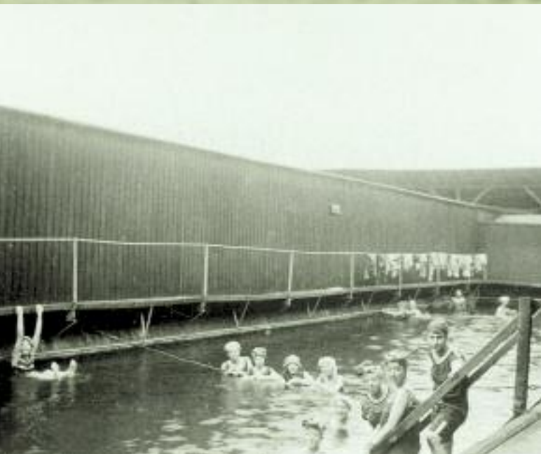
Die städtische Badeanstalt im Mühlengraben, 1910.