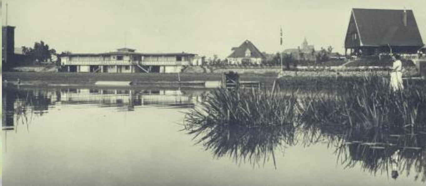
Das neu eröffnete Prinz-August-Wilhelm-Strandbad an der Sieg, 1933.

Leihgeld für einen Nachen 5,- Mark, 20 Stück Pfähle 10,- Mark, Nägel und Schrauben 5,- Mark und die Entfernung eines angeschwemmten alten Baumstammes aus dem Wasser 6,- Mark. Der Abbruch im Herbst, der Transport zum Wasserwerk und das Aufstellen in der Halle daselbst stellte er mit 132,- Mark in Rechnung.