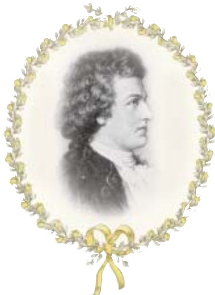
Johann Wolfgang von Goethe