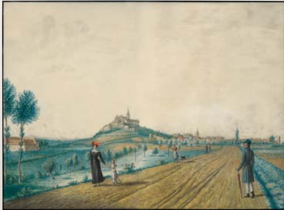
Siegburg von Südosten, nach 1825, kol. Lithografie von Bernhard Hundeshagen.

So brach er am 20. August 1820 zu einer mehrmonatigen Reise zu den Irrenanstalten Sonnenstein und Waldheim in Sachsen auf. Wegen seiner finanziellen Bedrängnis legte er die Reise zu Fuß zurück. In Berlin stellte er sich dem für die medizinische Sektion zuständigen Staatsrat Langermann und Minister von Altenstein vor. Aufgefordert, seine Empfehlungen zur Einrichtung und Leitung einer Irrenheilanstalt in schriftlicher Form vorzulegen, fertigte Jacobi noch in Berlin einen entsprechenden Entwurf, der den Beifall Langermanns und des Ministers fand. Trotz der wohlwollenden Aufnahme in Berlin dauerte es noch mehr als