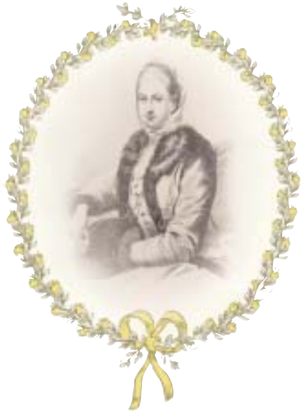
Die Eltern Max Jacobis, Helene Elisabeth, geb. von Clermont und Friedrich Heinrich Jacobi