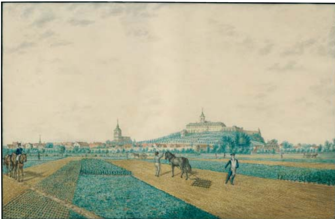
Siegburg von Südwesten, nach 1825, kol. Lithografie von Bernhard Hundeshagen.

Jacobi setzte 1795 sein Studium in Göttingen fort, bevor er Ende des Jahres elf Monate für einen Studienaufenthalt nach England und Schottland reiste. 1797 promovierte er in Erfurt dann zum Doktor der Medizin.