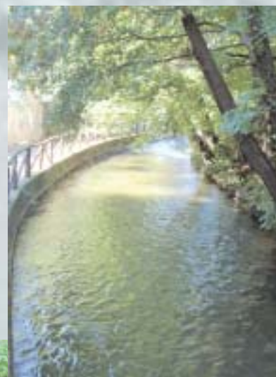
Leinpfad in Richtung Neue Poststraße

Um hier Rechte und Pflichten gleichmäßig zu verteilen, wurde 1924 nach längeren Verhandlungen eine Genossenschaft zum Ausbau und zur Unterhaltung des Siegburger Mühlengrabens gegründet. Mitglieder waren die Stadt, das Siegwerk und die privaten Mühlenbetreiber.