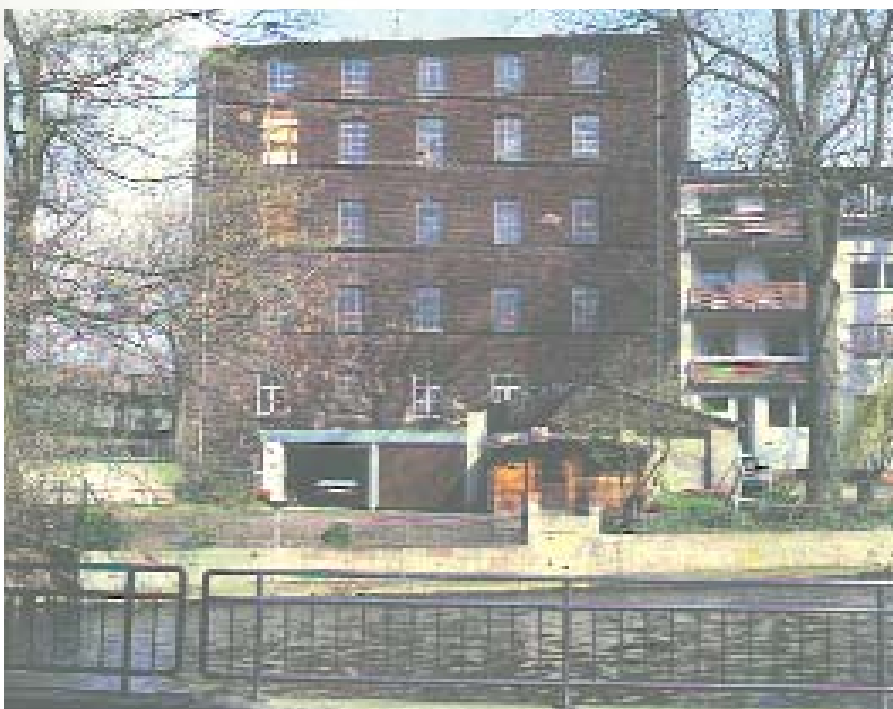
Die Mahlmühle, um 1990

Nach dem Entladen der Frachtkähne oberhalb der Mühlenwehre wurden die Boote entweder wieder stromauf zu den Wolsdorfer Brüchen zurückgetreidelt, in Abschnitten mit wenig Strömung sicherlich auch gestakt oder sie wurden umgesetzt und unterhalb der Mühlen mit Waren beladen, die auf dem Kölner Markt verkauft werden sollten. Die Töpfereiprodukte aus der Aulgasse, aber auch Tuche, die eine blühende Tuchmachersunft in Siegburg herstellte, gelangten so auf die Märkte der Hanse.