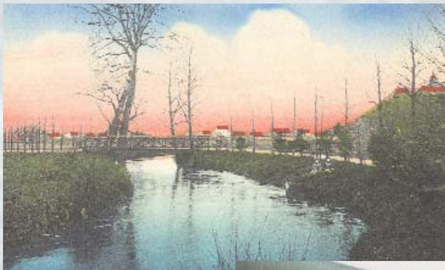
Oben: Postkarte um 1910. Rechts: Das Badebecken für Frauen in der Badeanstalt im Mühlengraben, um 1920.

Sei es, dass man den Klagen abhelfen wollte, sei es, dass der seit dem ausgehenden 19. Jahrhundert aufkommende Gedanke der Sportkultur auch in Siegburg Raum griff, im Jahre 1906 beschloss der Rat der Stadt, im Mühlengraben oberhalb der Kattunfabrik eine Badeanstalt einzurichten. „An Raum sind vorgesehen 400 qm