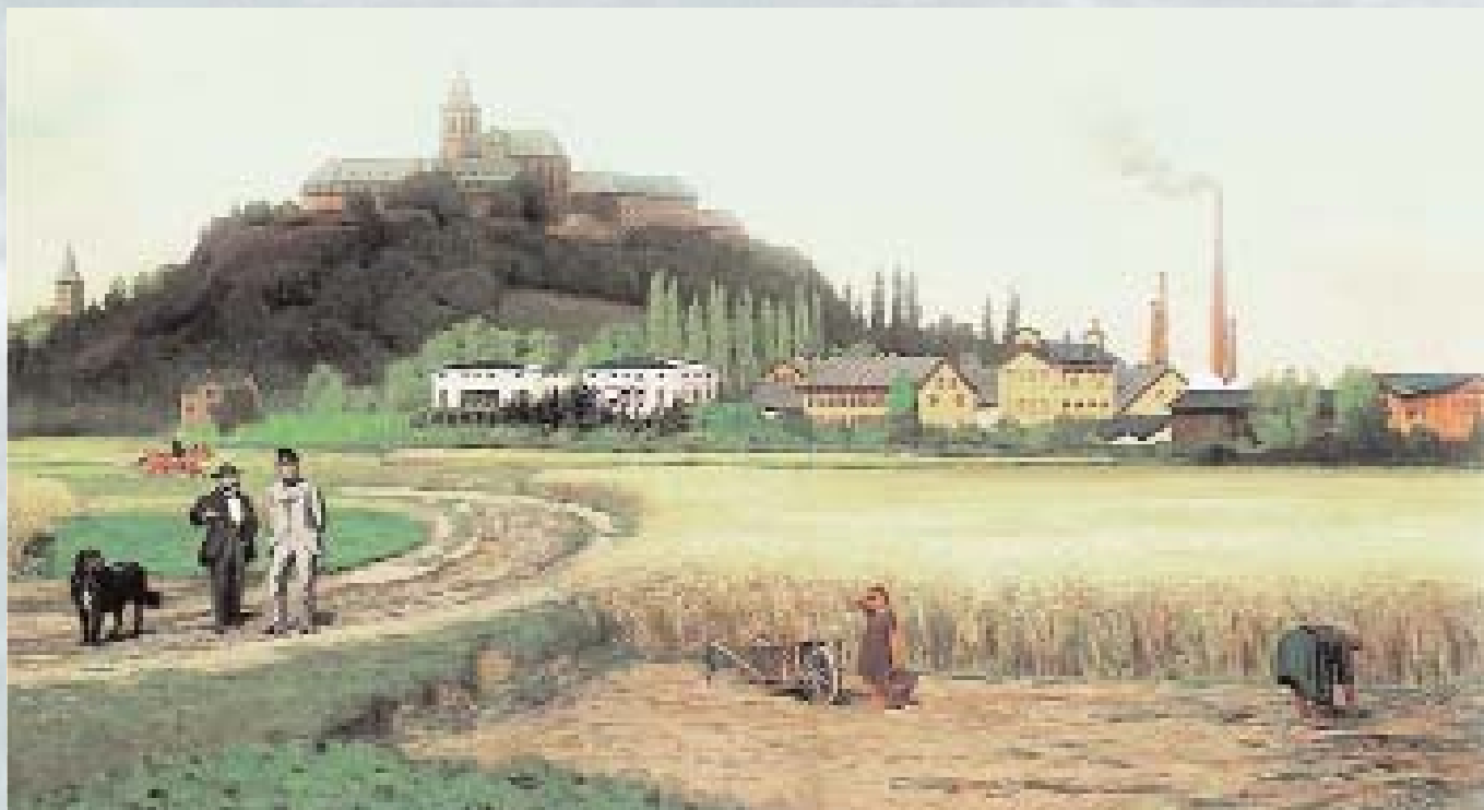
Blick auf den Michaelsberg, unterhalb davon die Kattunfabrik. Der Mühlengraben, im Bild nicht zu sehen, durchfließt das Fabrikareal.