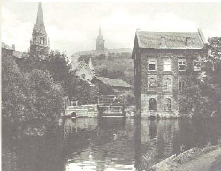
Blick auf die alten Mühlen, abgerissen 1936, links die evangelische Stadtkirche, im Zweiten Weltkrieg zerstört.

Der Mühlengraben spielte im Leben der Bürger eine wichtige Rolle. Hier standen die für das Gemeinwesen wichtigen Mühlen, hier schöpfte man Wasser, wusch Wäsche, aber hier geschahen auch Unfälle, wie die Schöffensprotokolle aus dem Jahre 1547 berichten, als man unter Zeugenschaft von Bürgermeister und Stadtschreiber einen Leichnam aus dem Mühlengraben zog, der „verdrunken“ war.